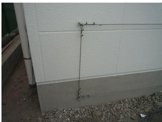
③外周ワイヤー設置状況