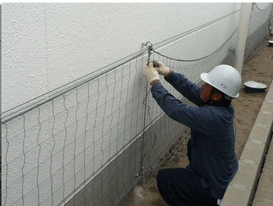
④ワイヤーにネット取り付け